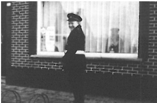
De garde sluit de rij (Hamse Hoeve 1969)