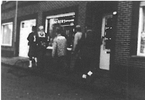
Maandagvoormiddag, rondgang (Hamse Hoeve 1969)

Sinds een 25-tal jaren is de oude traditie, dat alle partijen dinsdagvoormiddag op de markt samenkomen, terug in ere hersteld. De verschillende partijen marcheren in feestkleding de markt op en stellen zich op een vooraf afgesproken plaats op. De opstelling is zoals voor een vlag-gengroet bij het leger. De verschillende koningen stellen zich naast elkaar op, zij schouwen bij deze gelegenheid de "troepen". Nadien begint de echte viering van de koning, alle herbergen worden aangedaan.