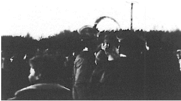
Koning op Germeer, 1989