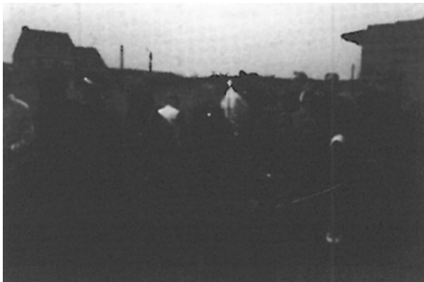
De garde kapt eerst (Hamse Hoeve, 1969)