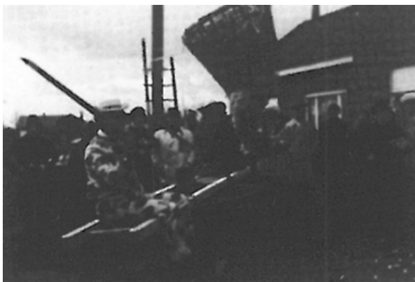
Hanekap op een karwiel (De Hei, 1969)