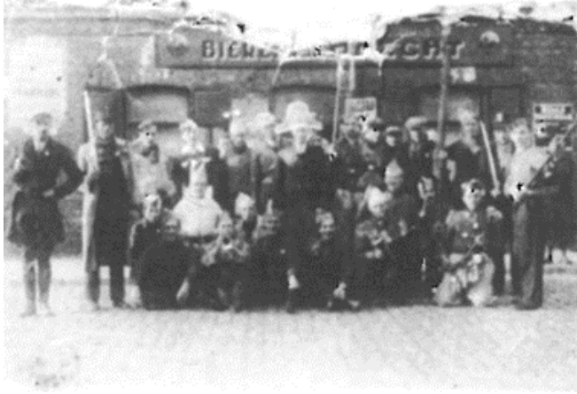
Een partij omstreeks 1930 voor de herberg van "De Schol"