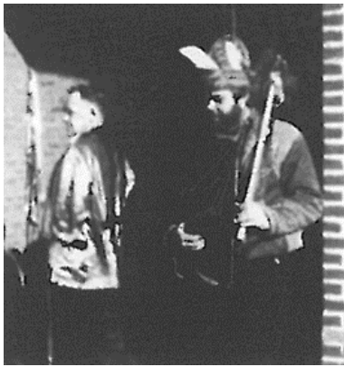
Oppasser in Rijnlandse "outfit", 1989