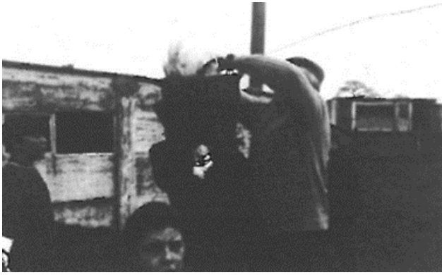
De haan wordt in de mand gehangen (Hamse Hoeven, 1969)