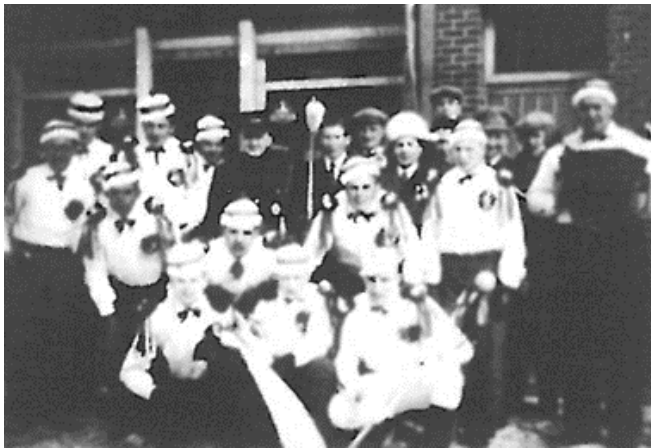
De partij van de Veldstraat