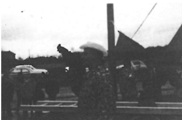
Het (laatste!) lied van de haan (De Heid, 1969)