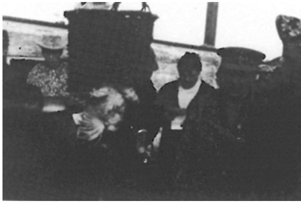
Onze koning is nu gekend (Hamse Hoeve, 1969)